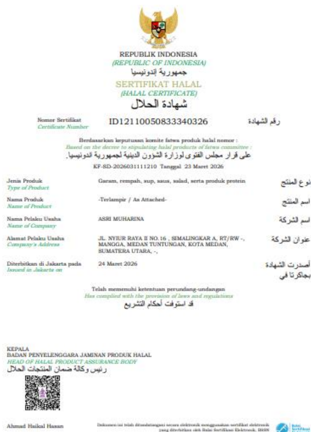
Gambar 4. Sertifikat Halal UMKM Pempek Anna

Berdasarkan Tabel 1, seluruh indikator keberhasilan kegiatan menunjukkan peningkatan yang signifikan setelah pelaksanaan pendampingan. Perubahan paling penting terlihat pada status sertifikasi halal UMKM Pempek Anna. Setelah seluruh proses pendampingan dan pengajuan dilaksanakan, sertifikat halal berhasil diterbitkan oleh BPJPH dalam waktu sekitar dua bulan sejak pengajuan dilakukan melalui Program Sertifikasi Halal Gratis (SEHATI). Terbitnya sertifikat halal menunjukkan bahwa seluruh persyaratan administrasi dan teknis yang dipersyaratkan telah dipenuhi oleh mitra sesuai ketentuan yang berlaku.