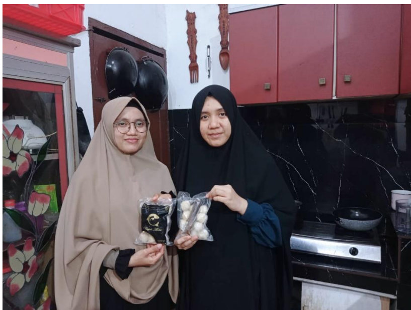
Gambar 2. Proses Pendampingan Proses Produk Halal di Tempat Pelaku Usaha